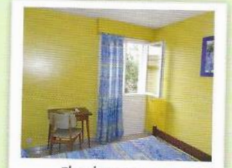
Chambre 1 personne