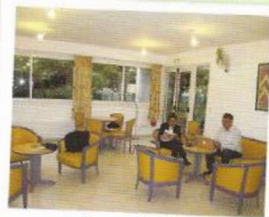
Salon rez de chaussée