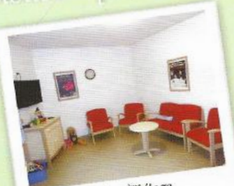
Salon 2 ème étage