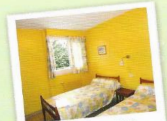
Chambre 2 personnes