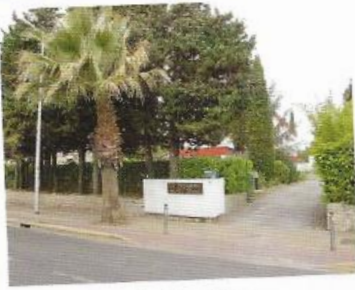
Entrée et parking

Maison d'accueil pour familles de personnes hospitalisées